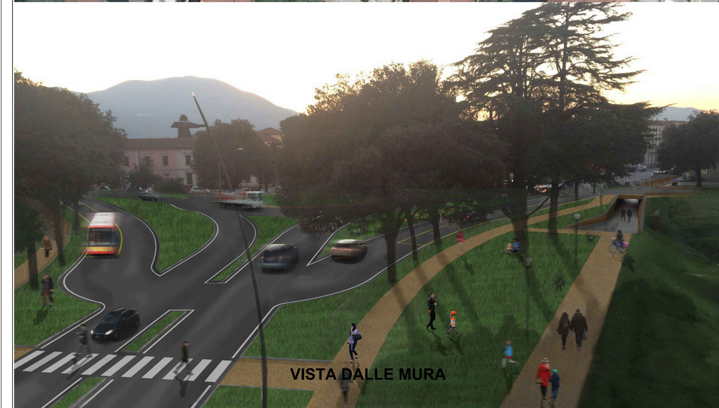
VISTA DALLE MURA